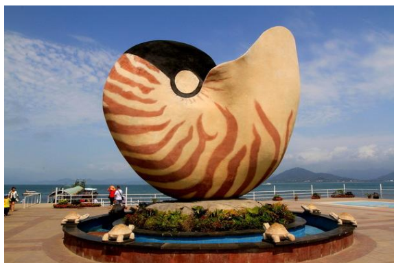
老税工 海面上的各类游艇、摩托艇让人激动万分，尤其是天上飞来的滑翔伞让人大为观止，目不暇接。

位于三亚市西南海岸附近海面，有两个东西相对而立的小岛，小岛附近胜产海龟，所以人们把两小岛称为东玳瑁洲和西玳瑁洲。西岛即西玳瑁洲。