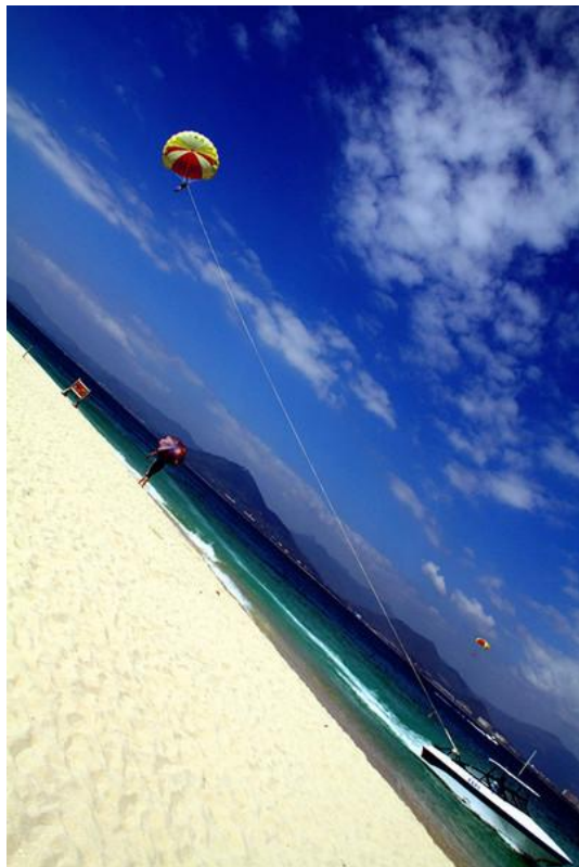
KICC 白色的沙滩，碧绿的海水，蔚蓝的天空。