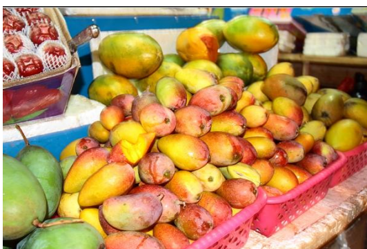
大老二皇后 第一市场的水果