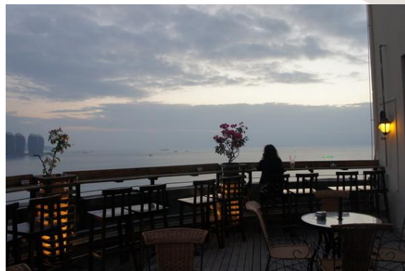
晴小姐 早苗咖啡店看日落