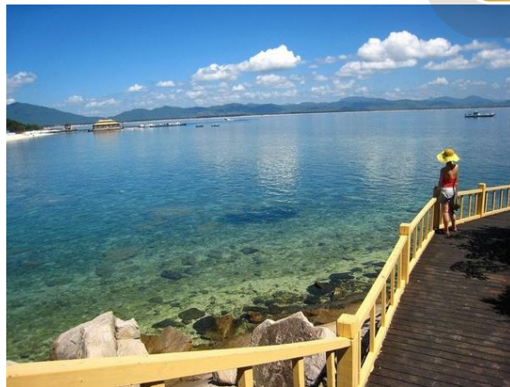
浅蓝 度假的心情，虽然短暂却也让我忘忧。