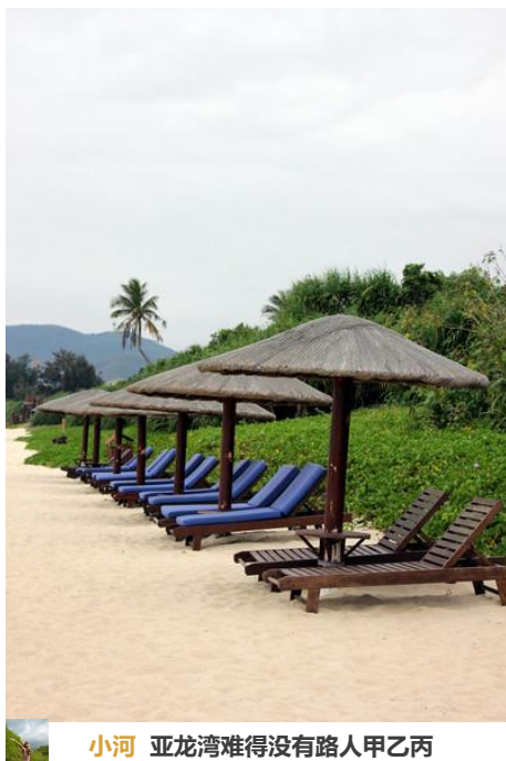
小河 亚龙湾难得没有路人甲乙丙