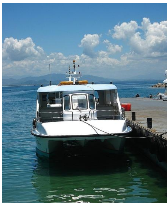
浅蓝 有一种阳光，洒在碌碌为营的生活里，一抹微亮，温暖、惬意。只有片刻，却也让生活有些不同。

探索者 点评：终于让我看到了想像中的海景，海水颜色由浅到深一直延伸到远处的山丘，真的很美。我们还潜了水，350一个人，不过这个价位的潜不到多深，也没有想像中电视上那么多珊瑚和鱼，只能说是尝试一下。不过还有更高价位的能潜到更深的地方。