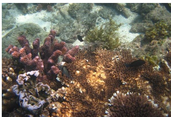
绝世小排骨 加井岛 自带相机 水下拍摄

绝世小排骨 点评：石梅湾最大的特点就是清静，真的没什么人。放眼望去，也就五六个人，摊在躺椅上，眼前就是美丽的大海，而不是沙滩上的人群。喜欢清静的朋友这里真的是首选。在这里的海滩上拍照永远都是你和美丽的沙滩大海，没有别人夹杂在你的照片里。沙滩上有很多小贝壳可以捡到，还有各色被海水冲上岸的小鱼。