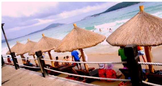
雪、蓝天白云 大太阳，最赞了