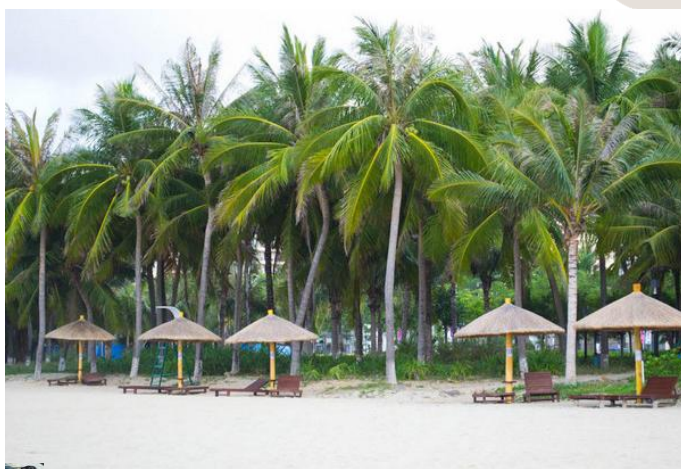
伊莎yuzi 这里是传说中的椰梦长廊，一排排的椰树

骑上摩托去拉萨 点评：走在沙滩上，一边是蓝蓝的海水，一边是高大的椰子树林，吹着微微的海风，看着在椰林下休闲玩耍的老人，真的是很惬意！