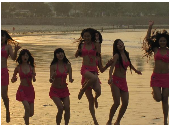
一直很安静 偶遇比基尼长发美女

柳絮飞飞 点评：三亚湾，不用走很远，就能体会三亚美的地方。沙滩上太多太多的螃蟹洞洞。悠闲，安静，市井。