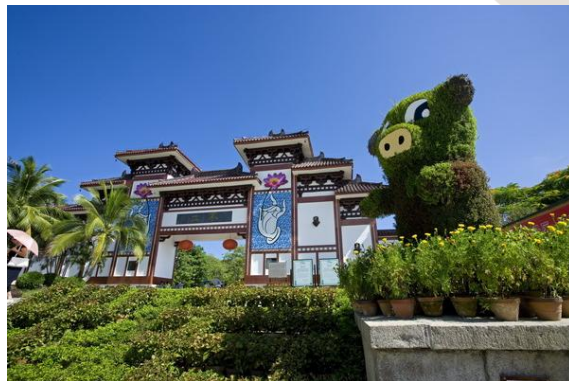
时间 不二门前的小猪

文青 点评：我们点了南山名斋梅菜扣肉，看起来和品尝起来都分不出来是不是肉，问服务员才知道是面筋做的，佛教饮食文化真是神奇，原来未孵化的鸡蛋属于“斋”的范围，这可能是和尚们唯一补充动物蛋白的来源了。