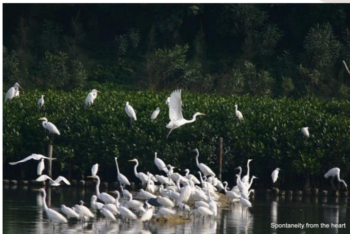
摄影 虽不能鱼水之欢，还可以鸟欢。