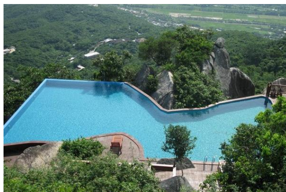
墨香如昔 这个泳池也是森林公园里的，很有天人合一的感觉。有木有？