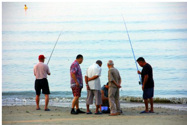
穆穆 老人们打着太极，钓着鱼。

“三亚有太多的椰子树，我们很喜欢喝新鲜的椰子水，那种刚刚掉下来的椰子，直接劈开就喝，然后吃里面的椰肉，才够鲜美。” 蜂蜂们如是说。在三亚的街道上走，只要你看到谁家小店的门口有一大堆青椰子，就说明店里面卖椰子水。你可以让店家帮你挑，然后帮你打开，一般青椰8块钱一个，红椰10块，很解渴。喝完椰汁之后，还可以让店家破开，吃里面的椰子肉哦，非常嫩滑。