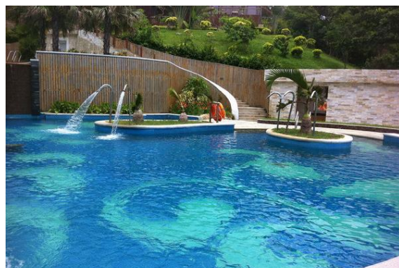
宝贝 临海木屋下面的游泳池

蜂蜂 宝贝 的三亚游记： http://www.mafengwo.cn/i/701100.html