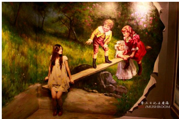
张欣妍蘑菇 参观的进程很快，以拍照为主，有些油画需要花心思揣摩画的初衷，才能找出最准确的拍摄角度。