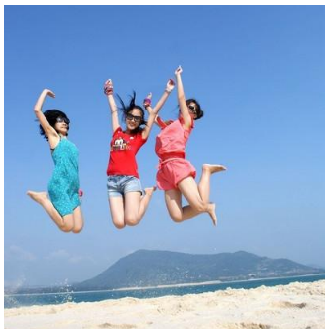
annieweiwei 石梅湾的沙很白。也挺细的。基本不扎脚。不过这种没有开发的岛多多少少有些碎珊瑚的。

安子 点评：艾美的清晨，寂静而美丽，独享海滩的感觉非常不错，充分的感受大海的温柔