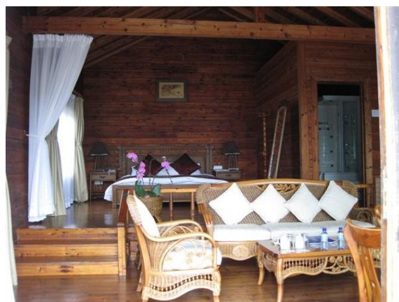
绝世小排骨 6683号临海木屋