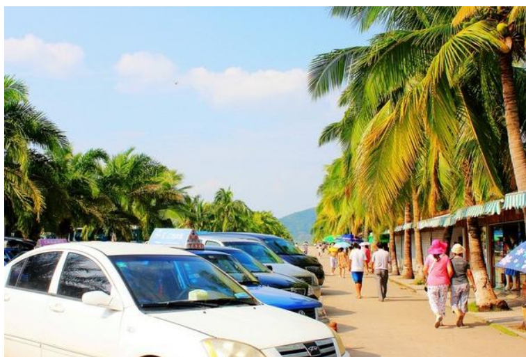
范儿爱游 三亚出租车

总站每天有三亚发往全省各地的长途班车，每20分钟就会有一趟发往海口的专线快车，豪华巴士票价为79元，普通巴士票价为49元。还有发往广东、广西、湖南、江西等省份的长途客车，每天约为20个班次。发车时间：07:00—23:00。汽车总站咨询电话：0898—88272440。