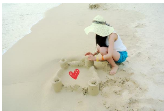
阳帅帅 海风拂面 烦恼散去