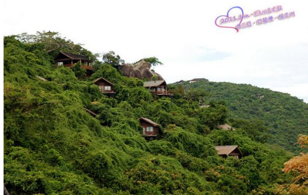
Elva未希 非诚勿扰2 舒淇住的鸟巢屋~~~~~