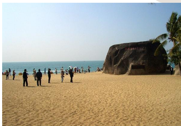
横山断云依水 天涯

相传很久以前，陵水黎族有两位仙女偷偷下凡，立身于南海中，为当地渔家指航打渔。王母娘娘知道后非常恼怒，派雷公雷母抓她们回去，二人不肯，化为双峰石，被劈为两截，一截掉在黎安附近的海中，一截飞到天涯之旁，成为今天的“南天一柱”。