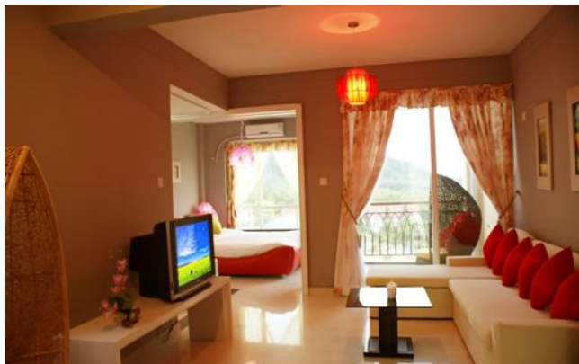
三亚阳光假日度假公寓（亚龙湾店）

喜來登：位置5分，大堂及硬件5分，花園及海灘5分； 萬豪：位置4.5分，大堂及硬件5分，花園及海灘4分； 凱萊：位置5分，大堂及硬件3分，花園及海灘4分； 天域：位置5分，大堂及硬件4分，花園及海灘4.5分； 假日：位置4分，大堂及硬件4分，花園及海灘4分； 環球城：位置3分，大堂及硬件4分，花園及海灘3分； 金棕櫚：位置3分，大堂及硬件4分，花園及海灘3分； 仙人掌：位置2分，大堂及硬件3.5分，花園及海灘2分。