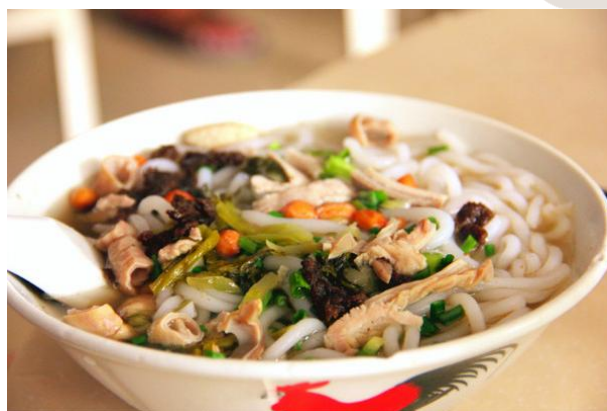
穆穆 8路车叮叮的开门声，空气里咸咸的海风味道，抱罗粉，清补凉，包子，各式稀饭。一天就这么开始了。