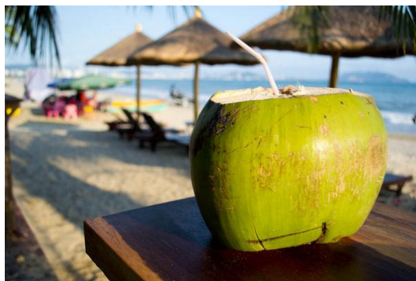
伊莎yuzi 清新的椰子让阳光显得没有那么恶毒