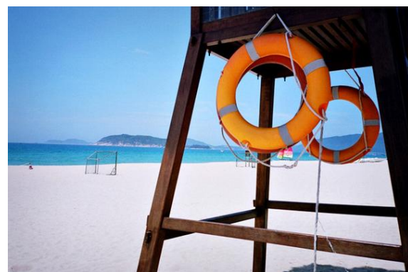
阿滋猫 蜈支洲岛沙滩白而细腻，海水清澈见底。