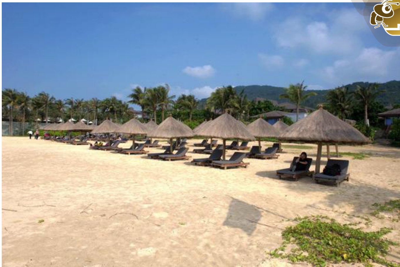
安子 石梅湾的海滩有6/7公里长，基本没有人，哈哈