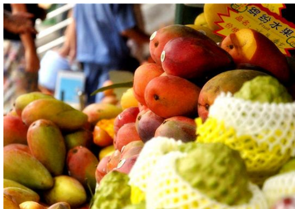
猩猩Bala 第一市场水果

除了清淡、味美、养生保健的特点外，还富含蛋白质、多种维生素和人体所需的多种氨基酸，营养丰富而且具有很高的药用价值，常期食用能养颜美容、延缓衰老，非常符合现代人的营养需求。